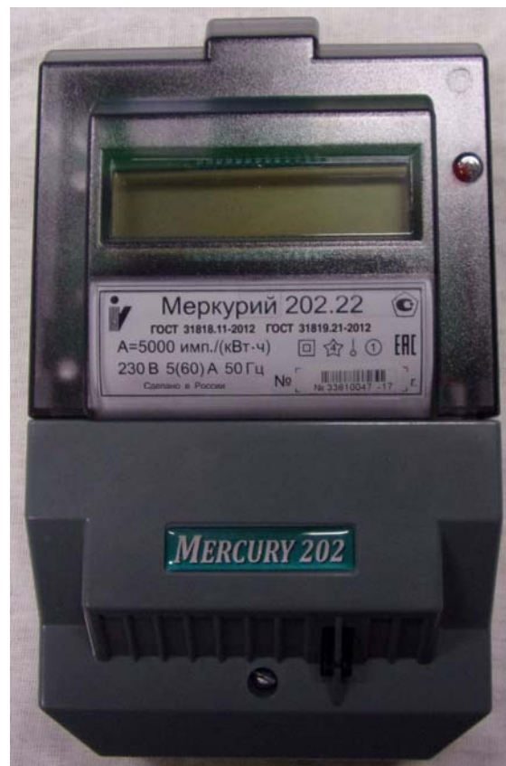
Рисунок 1 - Общий вид счетчика с УО