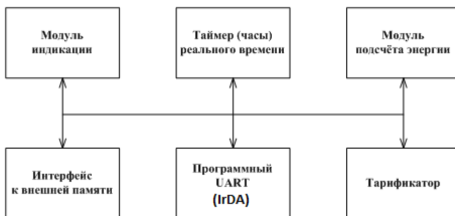
Рисунок 4 - Структура программного обеспечения «Меркурий 202»

В счётчиках с индексом «Т» используется программное обеспечение «Меркурий 202». Структура программного обеспечения «Меркурий 202» приведена на рисунке 4.