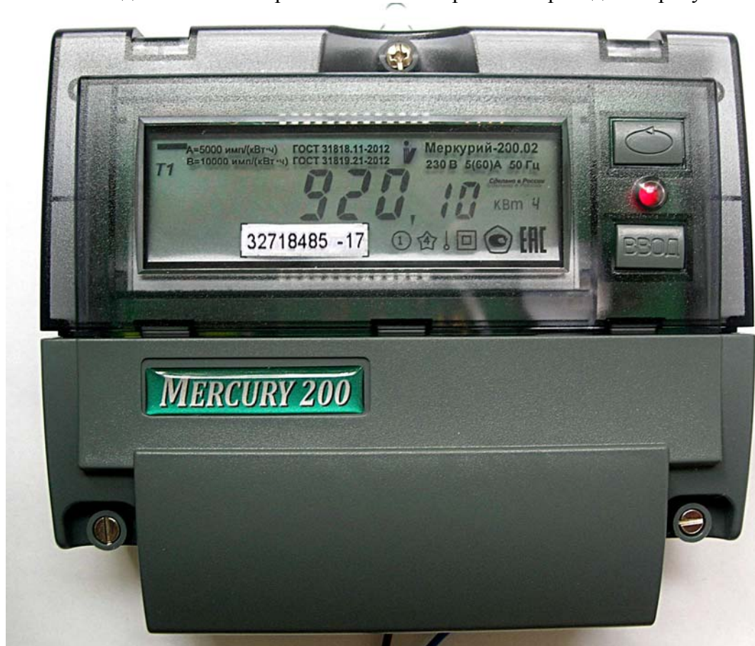
Рисунок 1 - Внешний вид счетчика с закрытой клеммной крышкой

Внешний вид счетчика с закрытой клеммной крышкой приведен на рисунке 1.