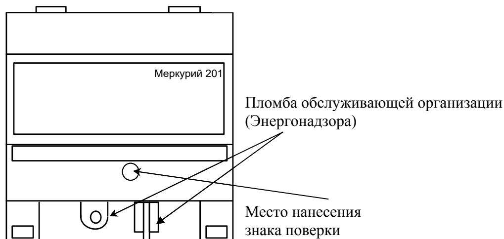
Рисунок 6 - Схема пломбировки от несанкционированного доступа, обозначение места нанесения знака поверки счётчиков «Меркурий 201.1», «Меркурий 201.2», «Меркурий 201.22», «Меркурий 201.3», «Меркурий 201.4», «Меркурий 201.42», «Меркурий 201.5», «Меркурий 201.6»